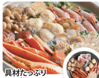
具材たっぷり かに鍋セット