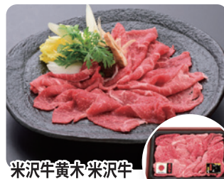
米沢牛黄木米沢牛 すき焼用切落とし 320g