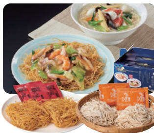
長崎グル麺食べ比べセット