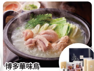
博多華味鳥 水たきセット