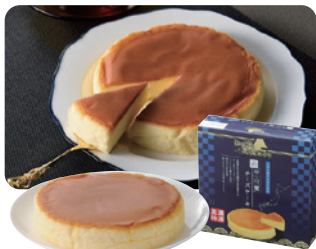
六甲山麓チーズケーキ