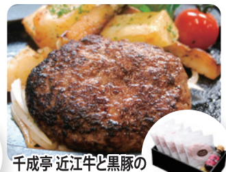
千成亭 近江牛と黒豚の ハンバーグ5個セット

[お見積・ご成約特典] ※金額55万円(税込)以上の方が対象です。※フェア開催時に既にご成約いただいている方は対象外とさせていただきます。 ※商品は後日のお届けとなります。※お見積特典・ご成約特典のプレゼントは、お好みの品をそれぞれ一品お選びください。 ※特典は予告なく変更となる場合もございます。